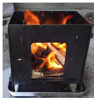
焚き火台で暖まる