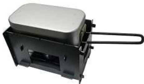
メスティンがピッタリ (ミニ)