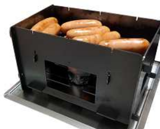
ウインナーがこぼれない (ミニ)