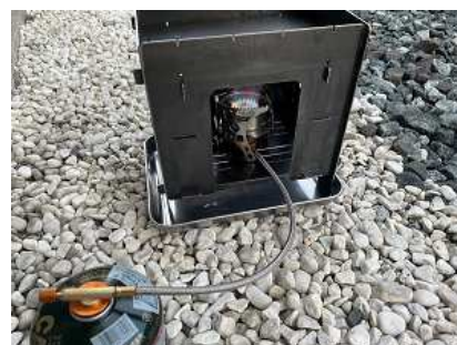
ガスバーナー使用